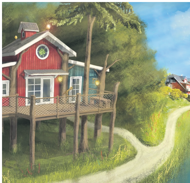
De nye hytter bliver opført i tilknytning til Hotel Fårup.