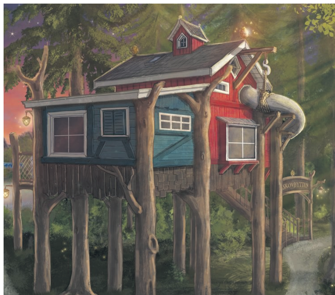
Trætopphytterne får blandt andet egen rutsjebane.